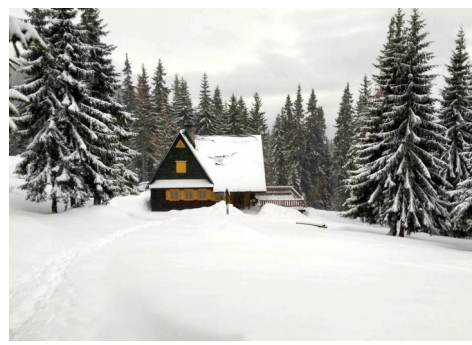
Chata pod Narużim

WYJAZD w dniu 04.03.2018 r. o godz. 5.00 z Placu Tysiąclecia (spod MOKSiR).