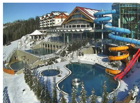
Termy w Bukowinie

WYJAZD w dniu 9.12.2018 r. o godz. 6.00 z Placu Tysiąclecia (spod MOKSiR).