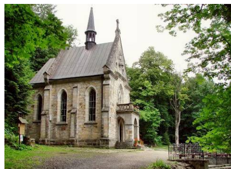
Pustelnia św. Jana

WYJAZD w dniu 15.06.2017 r. o godz. 6.00 z Placu Tysiąclecia (spod MOKSiR).