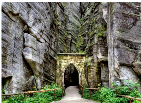
Teplickie Skalne Miasto