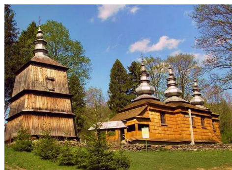
cerkiew w Rzepedzi