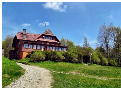
schronisko na Błatniej