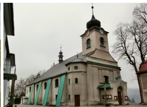
kościół w Istebnej

WYJAZD w dniu 6.11.2016 r. o godz. 7.00 z Placu Tysiąclecia (spod MOKSiR).