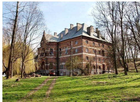
dwór w Ściborzycach