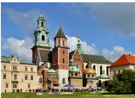
Wawel – katedra

Wawel - zwiedzanie Katedry (bez dzwonu Zygmunta i grobów królewskich, możliwe wejście do krypty grobowej Prezydenta Kaczyńskiego), dziedziniec wawelski, wejście do komnat, ulica Grodzka, Rynek, Collegium Maius, kościół św Anny, ul. Jagiellońska, Plac Szczepański, ul. Szpitalna, Planty, Barbakan, Plac Jana Matejki.