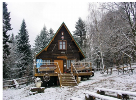
schronisko na Kudłaczach

WYJAZD w dniu 01.01.2015 r. o godz. 9.00 z Placu Tysiąclecia (spod MOKSiR).