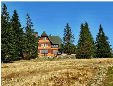
Schronisko na Rysiance

przejście: Żabnica Skałka – Hala Boracza (schronisko) – Redykałny Wierch – Lipowski Wierch (1324 m) - Hala Lipowska (schronisko) – Hala Rysianka (schronisko) – Romanka (1366 m)– Żabnica Skałka. Czas przejścia ok. 7 godz. (ok. 17 km).