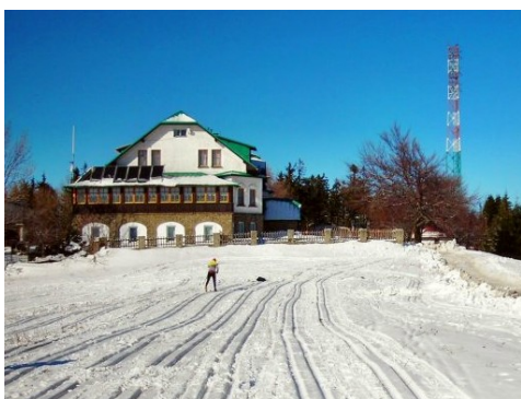
schronisko na Magurce Wilkowskiej

W PROGRAMIE: przejście przełęcz Przegibek – Magurka Wilkowska (schronisko PTTK) – Czupel – Międzybrodzie Bialskie. Czas przejścia ok. 4 godz.