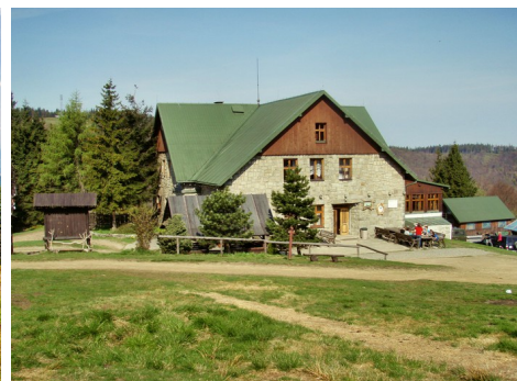
schronisko pod Klimczokiem

WYJAZD w dniu 01.03.2015 r. o godz. 7.00 z Placu Tysiąclecia (spod MOKSiR).