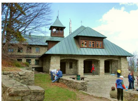
schronisko na Szyndzielni

wyjazd kolejką na Szyndzielnię , przejście trasy: Szyndzielnia – Klimczok - schronisko pod Klimczokiem – Szczyrk. Czas przejścia ok. 4 godz.