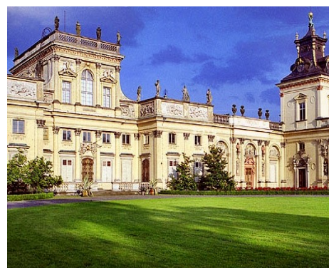
Pałac w Wilanowie

CENA: członkowie PTTK – 380 zł. sympatycy - 395 zł.